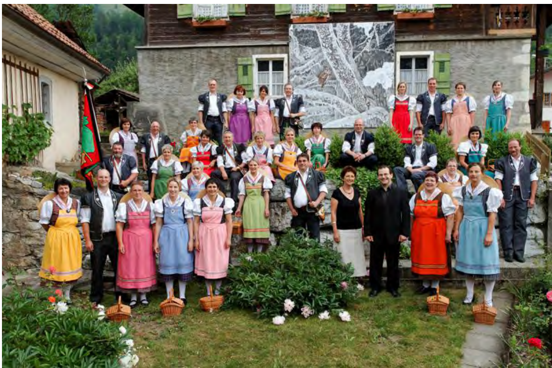
Le comité d'organisation

Au terme de cette belle année commémorative, le comité d'organisation et l'ensemble des choristes tiennent à remercier toutes les personnes qui se sont engagées à leurs côtés durant les manifestations de cette année. Ils expriment leur vive reconnaissance à tous les bénévoles qui ont rendu possibles ces projets. Cette reconnaissance est également adressée aux autorités communales et paroissiales, aux institutions et aux entreprises qui, par leur générosité, ont permis la mise sur pied d'un programme ambitieux.