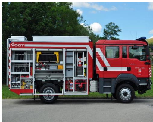
Exemple d'un tonne-pompe

Pour Grandvillard, l'investissement représente 22,08 % du solde à payer, soit Fr. 66'240.- .