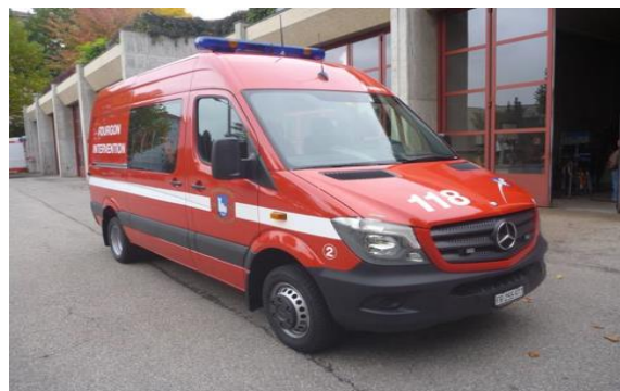
Exemple d'un bus de transport

Répartition entre les communes de Haut-Intyamou, de Bas-Intyamou et de Grandvillard selon la population au 31 décembre 2016. Pour Grandvillard, l'investissement représente 22,08 % du solde à payer, soit Fr. 16'560.- .